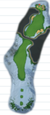
Hole 3 - Par 5