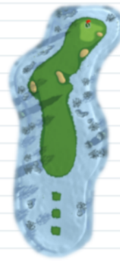
Hole 1 - Par 4