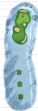
Hole 7 - Par 3