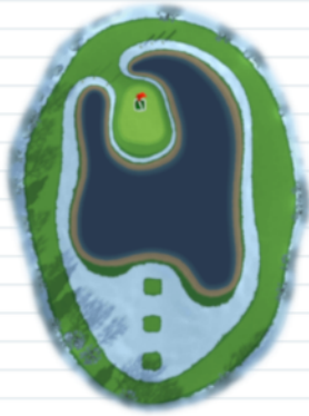
Hole 4 - Par 3