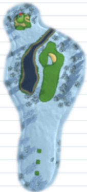
Hole 6 - Par 4