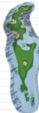
Hole 9 - Par 5