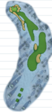
Hole 5 - Par 5